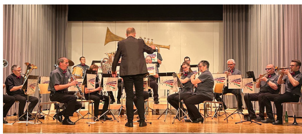
Foto: Jahreskonzert vom 9. Mai 2026

Am 22. November laden wir Sie herzlich zu unserem diesjährigen Kirchenkonzert ein.