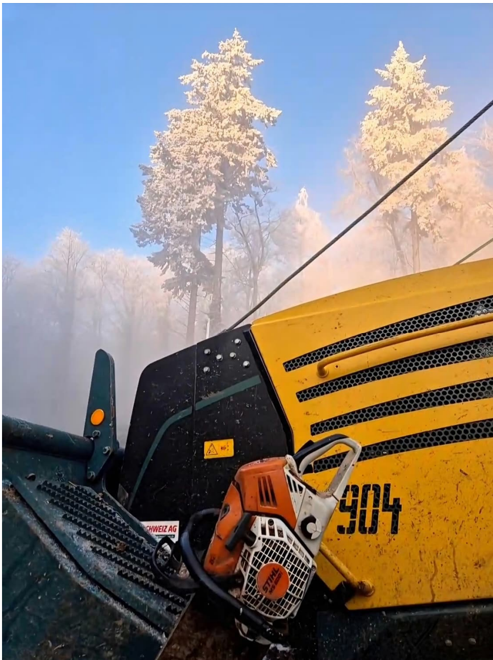
Winterstimmung auf dem Homberg