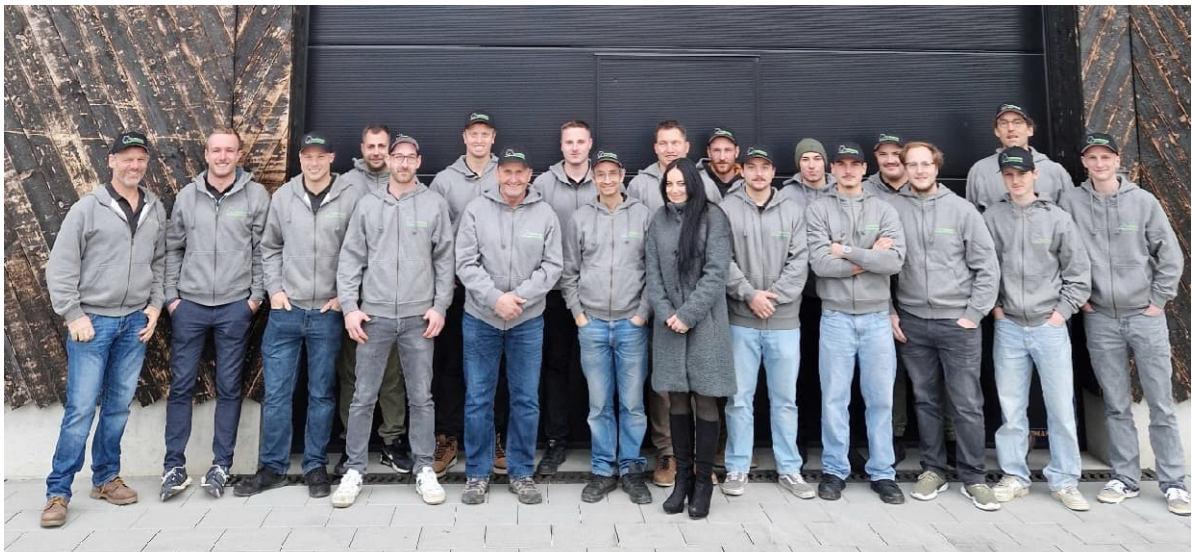
Abb. 1: Das Team des Forstbetriebs Homberg-Schenkenberg anlässlich des Betriebsausfluges im Dezember 2025

Aktuell bilden wir drei Lernende aus. Im Sommer 2026 kommt ein neuer Lehrling dazu.