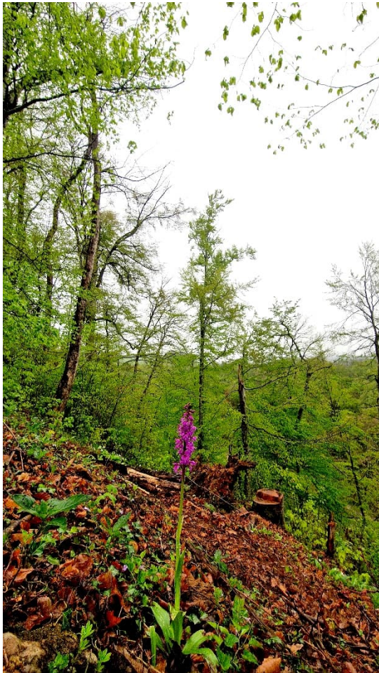
Ergebnis einer Auflichtung in einem für unser Gebiet typischen Orchideen-Buchenwald

Auf Verjüngungsflächen arbeiten wir in der Regel mit dem was die Natur hergibt – mit der Naturverjüngung. Auf geeigneten Flächen ergänzen wir die vorhandene Naturverjüngung mit speziellen Baumarten. Im Rahmen des kantonalen Programms zur Förderung von seltenen und klimafitten Baumarten pflanzten wir 2025 an drei Standorten Elsbeeren und Wildbirnen sowie Sommerlinden, Feldahorne und den Schneeballblättrigen Ahorn. An einem Standort mit bestehenden alten Eiben brachten wir 100 junge Eiben ein, um auch diese Baumart zu erhalten.