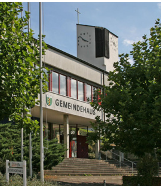
Mittel- und längerfristig soll das Gemeindehaus optimaler genutzt werden.