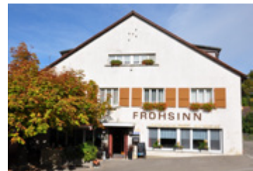
Eine vielfältige, innovative Restauration fördert und stärkt auch das Standortmarketing der Gemeinde wesentlich.