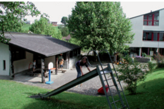
Die Gemeinde setzt sich für moderne, zeitgemässe Schulanlagen ein.