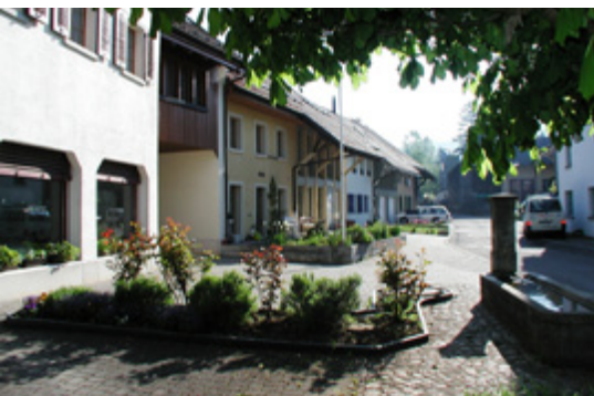
Zeihen hat hohe Wohnqualitäten