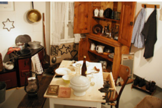
Das Dorfmuseum als Hüterin des Kulturgutes unserer Gemeinde.