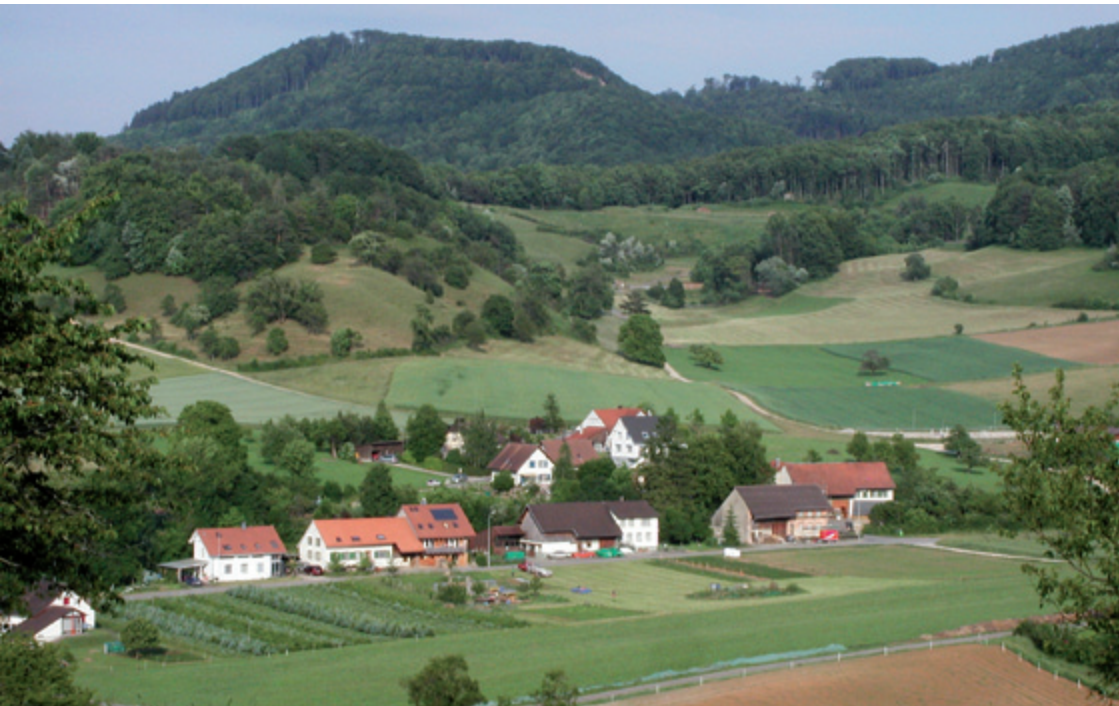
Wertvolle Landschaftsstrukturen, gestufte Waldränder mit nahtlosem Übergang in Wald im Naturschutzgebiet Lochmatt-Eichwald.